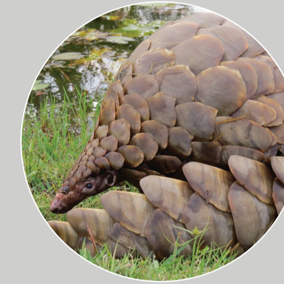
ลิ้นเทมมิก Manis (Smutsia) temminckii

ลิ้นสายพันธุ์แอฟริกันจะไม่มีขนแข็งแทรกอยู่ระหว่างเกล็ด