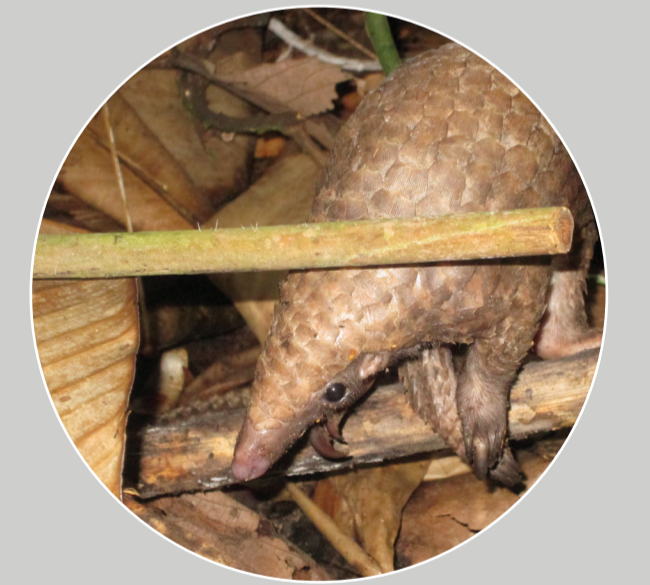
ลิ้นต้นไม้ท้องขาว Manis (Phataginus) tricuspis

ดูข้อมูลเพิ่มเติมเกี่ยวกับตัวลิ้นเพิ่มเติมได้ที่ http://www.usaidwildlifeasia.org/resources