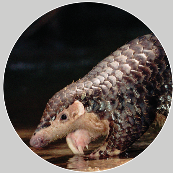
ลิ้นจีน Manis pentadactyla

ลิ้นสายพันธุ์ที่พบในทวีปเอเชียจะมีขนแข็งแทรกอยู่ระหว่างเกล็ด