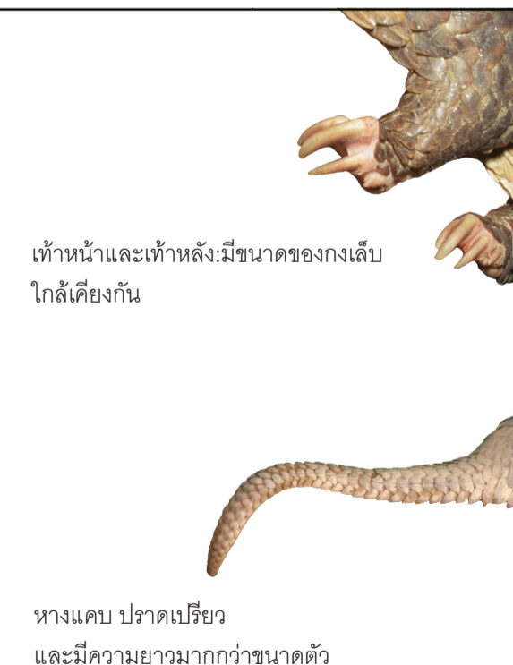
เท้าหน้าและเท้าหลังมีขนาดของงเล็บใกล้เคียงกัน หางแคบ ปราดเปรี้ยว และมีความยาวมากกว่าขนาดตัว