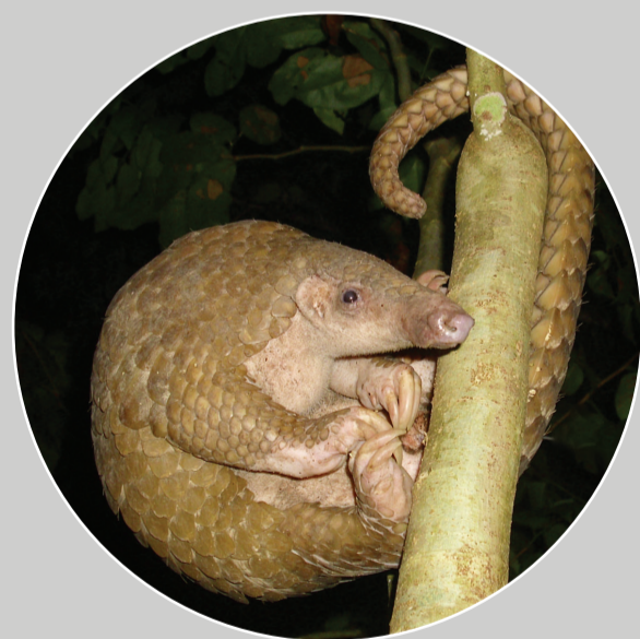
ลิ้นฟิลิปปินส์ Manis culionensis