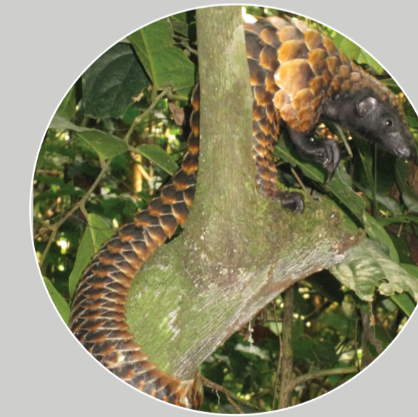
ลิ้นต้นไม้ท้องดำ Manis (Phataginus) tetradactyla