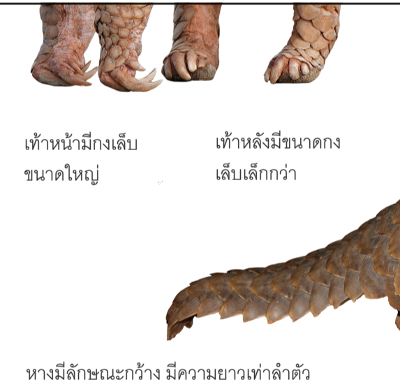
เท้าหน้ามีงเล็บขนาดใหญ่ เท้าหลังมีขนาดงเล็บเล็กกว่า หางมีลักษณะกว้าง มีความยาวเท่าลำตัว

ลิ้นสายพันธุ์เหล่านี้มักอาศัยอยู่บนต้นไม้ มีขนาดงเล็บเท้ากันทั้งเท้าหน้าและหลัง หางมีขนาดเล็กแคบ ปราดเปรี้ยว มีความยาวกว่าขนาดลำตัว