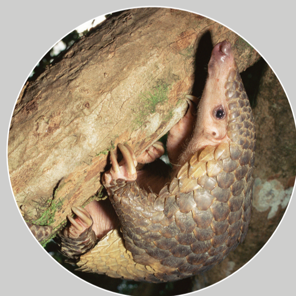
ลิ้นชุนดา Manis javanica