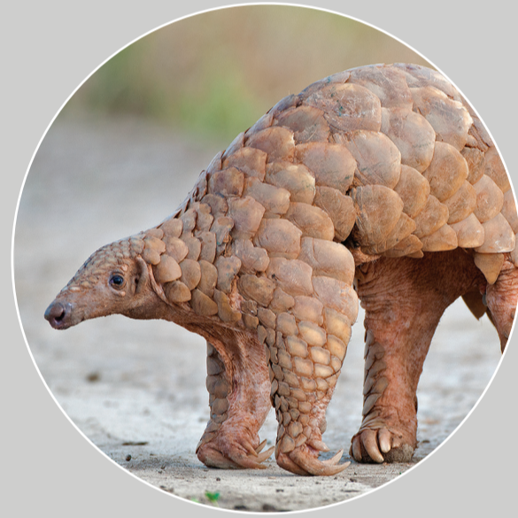
ลิ้นอินเดีย Manis crassicaudata