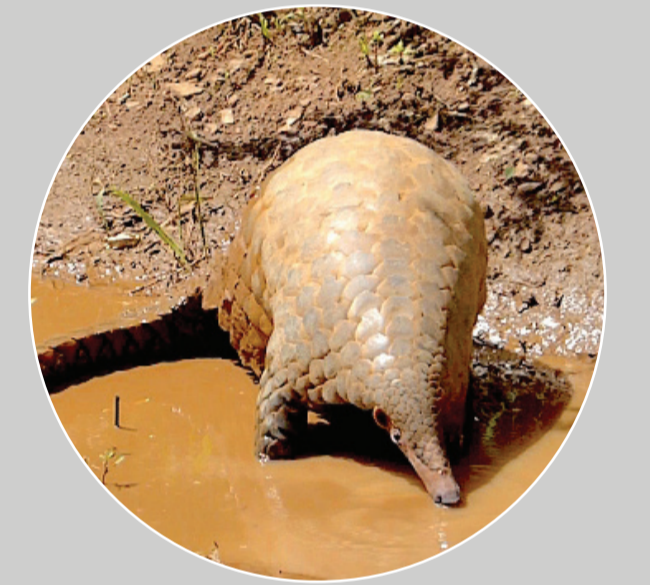
ลิ้นยักซ์ Manis (Smutsia) gigantea